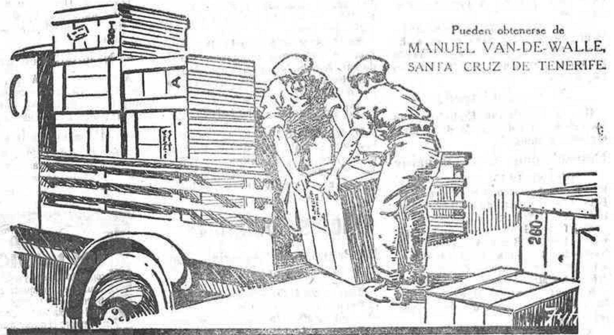
Pueden obtenerse de MANUEL VAN-DE-WALLE, SANTA CRUZ DE TENERIFE.

LOS BANDAJES DUNLOP Macizos normales. Macizos super-elásticos. Macizos "Giant Single."