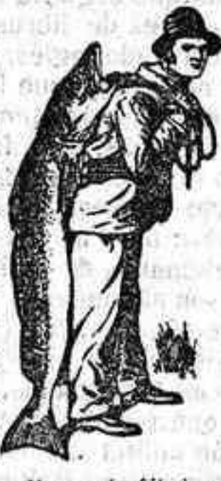
Marca de fábrica.

Es un contrasentido confiar la salud de los hijos a remedios de baja calidad cuando la Emulsión SCOTT no ha cesado de curar durante 40 años donde todo otro remedio ha resultado inútil.