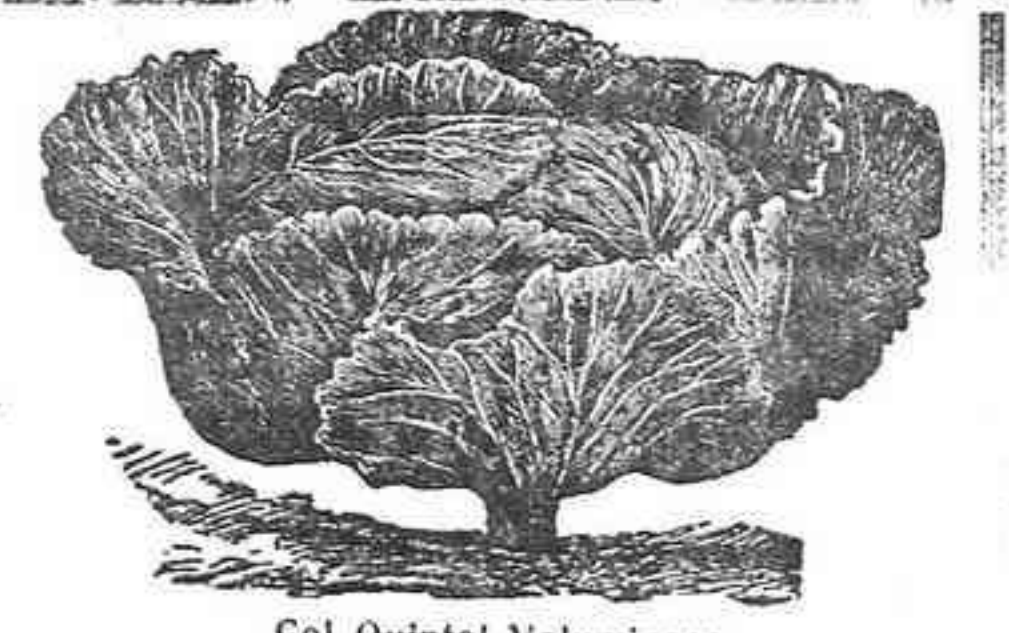
Col Quintal Voluminosa

SEMILLAS DE HORTALIZAS DE GERMINACION GARANTIZADAS SEMILLA DE ALFALFA MALAGUEÑA El mejor forraje que existe para el ganado.—Méndez Núñez 16. Santa Cruz de Tenerife