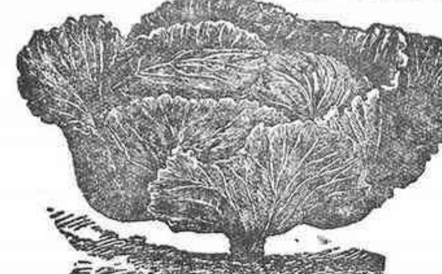
Col Quintal Voluminosa

Vapor "GUANCHE" Todos los Miércoles y los Sábados para los de la Gomera. Vapor "ESPERANZA" Todos los Martes y los Domingos para los del Sur de Tenerife. Se recibe carga en este muelle el día antes y el de la salida. Para informes: Marina 15, Dpto. de Carga. Teléfono núm. 507.