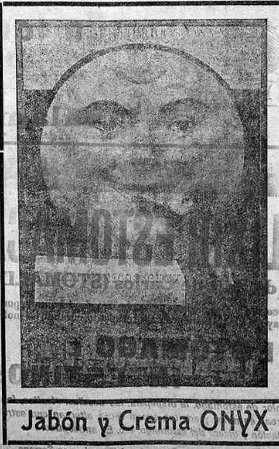
Jabón y Crema ONYX

¿Hay algo más desagradable y nocivo que una boca descuidada?