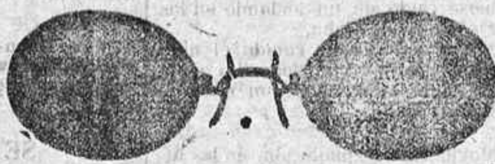
Este modelo, en níquel, 5 pesetas.

Inmenso surtido en toda clase de Gafas o Lentes, en oro; oro chapeado, níquel y concha; GAFA o LENTE, oro chapeado, clase garantizada, con cristales graduados, a 12 pesetas; en níquel, 5. ESTUCHE PIEL, AMERICANO, 1,25; en relación de precio son los restantes.