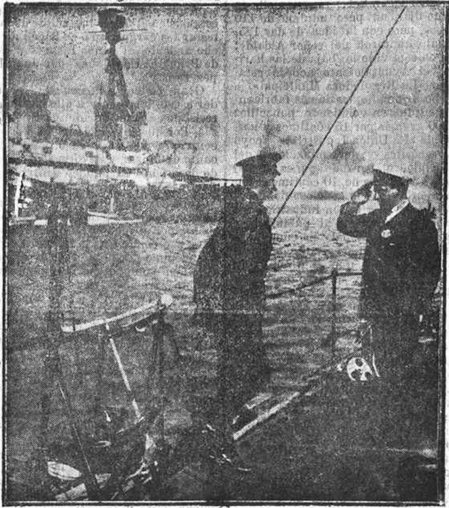
La muerte de Lord Kitchener.—Lord Kitchener embarcando

No se ha ocupado toda la prensa, sin distinción de matices, del vergonzoso, así, vergonzoso tráfico exterior que se está llevando a cabo con las patatas? Puede igno-