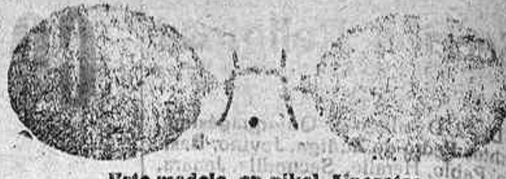
Este modelo, en níquel, 5 pesetas.

Gran surtido en relojes finos y corrientes, en ORO, DE SEÑORA Y CABALLERO; relojes de plata, acero y níquel, marcas escogidas; despertadores de bolsillo, con esteras Radio-RELOJ, ORO DE LEY, en correa, para caballero o señora, 40 pesetas; en níquel, 7. Imperioso surtido en toda clase de: Gafas o Lentes, en oro, oro chapado, níquel y concha; GAFAS O LENTE, oro chapado, clase garantizada, con cristales graduados, a 12 pesetas; en níquel, 5. ESTUCHE PIEL AMERICANO, 1,25 en relación de precio con los restantes. Se despachan recatas de los señores oculistas. Primera casa para instalaciones de Relojes de torre, dando grandes facilidades para los pagos.