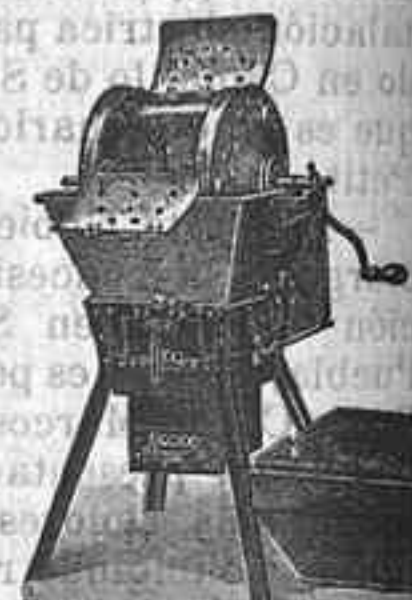
Máquina de lavar. Tipo 1911

Util á todos: desde la familia más reducida hasta los más grandes establecimientos.