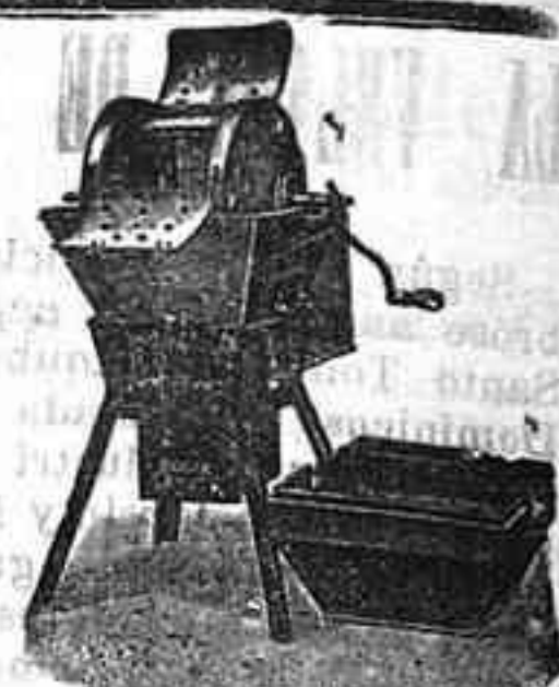
Máquina de lavar Todo Ve

Y a todo: desde la familia más reducida hasta los más grandes establecimientos.