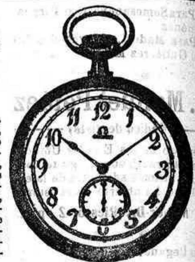
OMEGA LEGITIMO, a 27 Pesetas.

Esta casa tiene demostrado, y ninguna otra puede dudar, las ventajas en todos sus artículos, desde un reloj de oro de caballero y señora, en repeticiones «Cronómetros, Cronómetros y otros en marcas «Omegas», «Juvenia», «Longines», «Amoras» de precisión de varias marcas. Relojes corrientes en plata, acero, níquel y fantasía en marcas «Omegas», «Long», «Waltan» e infinidad de clases y marcas. Relojes pulseras en oro, plata y chapado. Relojes de pared, estilo inglés, roble, nogal y caoba; modelos exclusivos en carrillón o cuartos y corrientes. Despertadores, sobre mesa y corrientes. Despertadores gran fantasía, Medallas y cadenas.