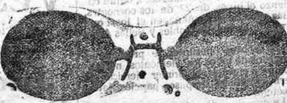
Este modelo; en níquel, 5 pesetas

Gran surtido en relojes finos y corrientes, en ORO, DE SENORAY CABALLERO; relojes de plata, acero y níquel, marcas escogidas; despertadores de bolsillo con esferas Radio. RELOJ, ORO DE LEY, en correa, para caballero o señora, 40 pesetas; en níquel, 7.