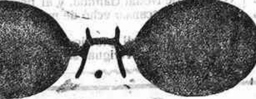
Este modelo, en níquel, 5 pesetas.

Plaza Mayor, 40 (acera de Correos), Salamanca. A pesar de la gran subida de la mayoría de los artículos, sigo vendiendo a los mismos precios. Gran surtido en relojes finos y corrientes, en ORO, DE SEÑORAY CABALLERO; relojes de plata, acero y níquel, marcas escogidas; despertadores de bolsillo con esferas Radio. RELOJ, ORO DE LEY, en correa, para caballero o señora, 40 pesetas; en níquel, 7.