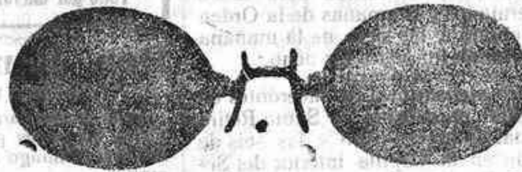
Este modelo, en níquel, 5 pesetas.

Se despachan recetas de los señores oculistas. Primera casa para instalaciones de relojes de torre, dando grandes facilidades para los pagos. Se construyen toda clase de ruedas dentadas, precios sin competencia.