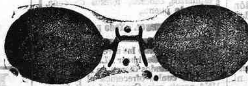
Este modelo, en níquel, 5 pesetas.

Gran surtido en relojes finos y corrientes, en ORO, DE SEÑORAY CABALLERO; relojes de plata, acero y níquel, marcas escogidas; despertadores de bolsillo con esferas Radio. RELOJ, ORO DE LEY, en correa, para caballero o señora, 40 pesetas; en níquel, 7.