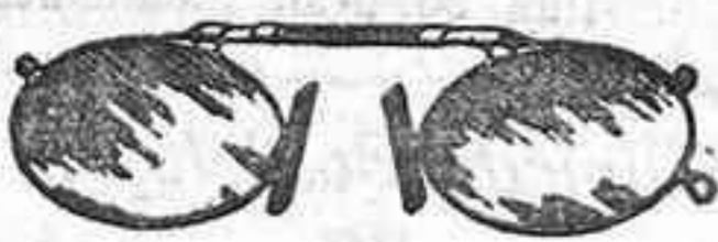
Lentes o Gatas de CRISTAL ROCA, 5 Pesetas.