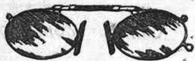
Lentes o Gatas de CRISTAL ROCA, 5 Pesetas.