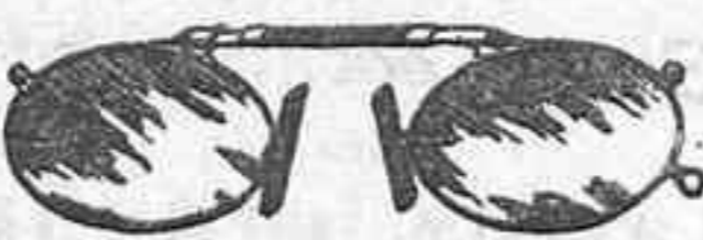
Lentes o Gatas de CRISTAL ROCA, 5 Pesetas.