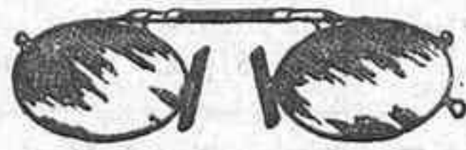
Lentes o Gatas de CRISTAL ROCA, 5 Pesetas.