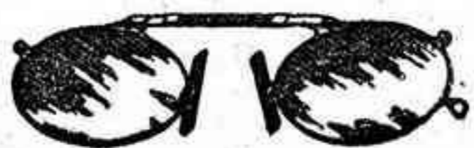
Lentes o Gatas de CRISTAL ROCA, 5 Pesetas.