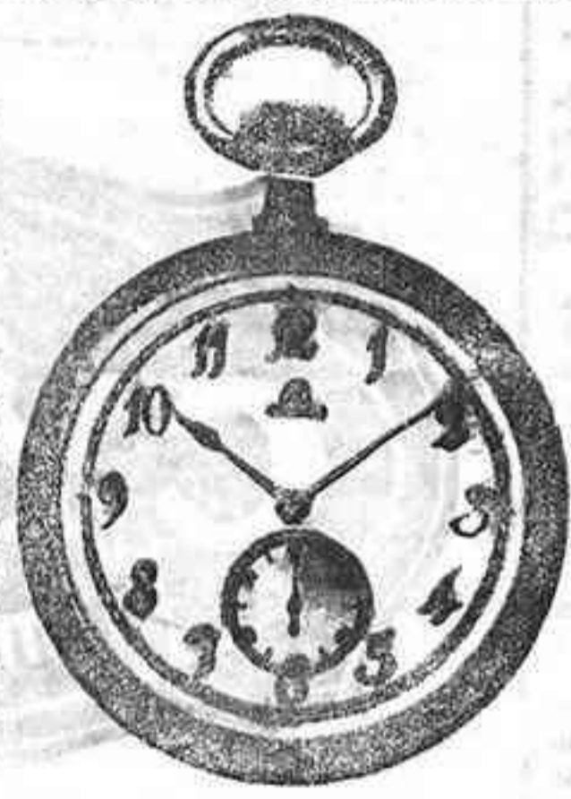
OMEGA LEGITIMO, a 27 Pesetas

Esta casa tiene demostrado, y ninguna otra puede ser las ventajas en todos sus artículos, desde los relojes de oro de caballero y señora, en repeticiones, Cronómetros, Cronómetros y otros en marcas «Omega», «Juvénia», «Leagica», «Anoras» de precisión de varias marcas. Relojes corrientes en plata, acero, níquel y fantasía en marcas «Omega», «Long», «Waltan» e infinidad de clases y, más cas. Relojes pulseras en oro, plata y chapado. Relojes de pared, estilo inglés, roble, nogal y caoba; modelos exclusivos en carrillón o cuartos y corrientes. Despertadores, sobre mesa y corrientes. Despertadores gran fantasía. Medallas y carteras.