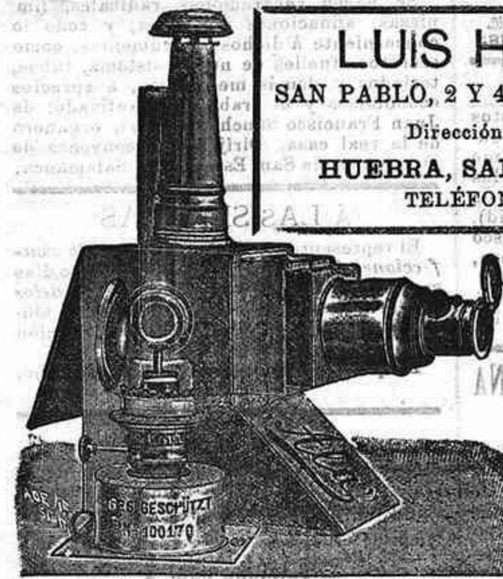
Aparatos de proyección completos, desde 125 pts.

LUIS HUEBRA SAN PABLO, 2 Y 4 SALAMANCA Dirección telegráfica: HUEBRA, SAN PABLO, 2 Y 4 TELÉFONOS, 88 Y 41