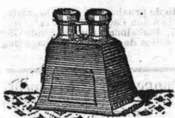
Stereoscopi y doce vistas: posición de 1900, 12'50 PTS.

PLACAS Y PAPELES DE LUMIERRE, GUILLENINOT, ST. CLAIR, LIESEGANG, AMERICANAS Y ALEMANAS