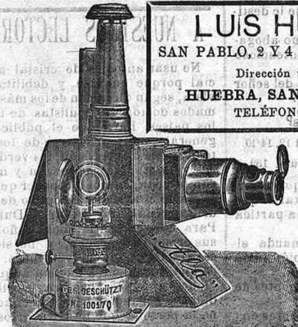
Aparatos de proyección completos, desde 120 pts.

LUIS HUEBRA SAN PABLO, 2 Y 4 SALAMANCA Dirección telegráfica: HUEBRA, SAN PABLO, 2 Y 4 TELÉFONOS, 88 Y 41