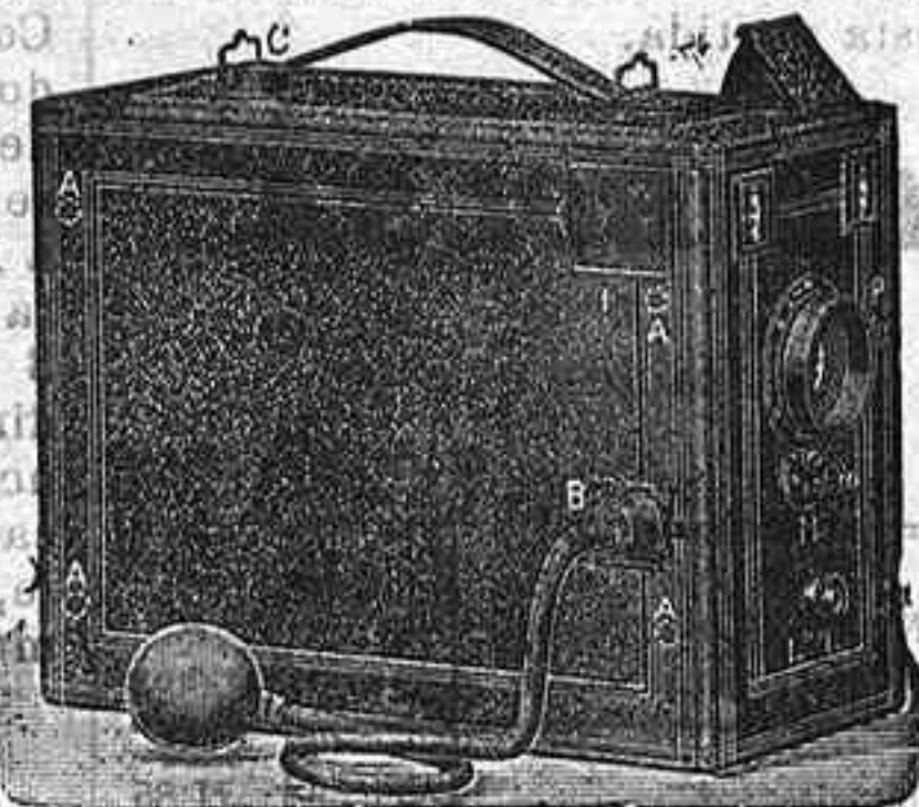
Detective de 6 h por 9 de 6 placas á 9'50

Kodak cartucho plegante Bull, Falcón, Le Ceniz, Le Bronie