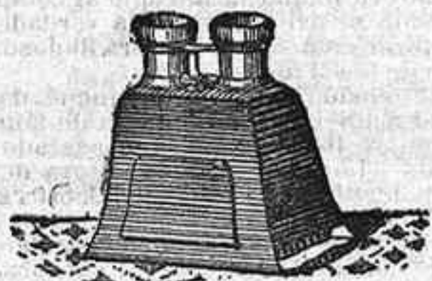
Stereoscopo y doce vistas exposición de 1900. 12'50 PTS.

PLACAS Y PAPELES DE LUMIERE, GUILLENINOT, ST. CLAIR, LIESEGANG, AMERICANAS Y ALEMANAS