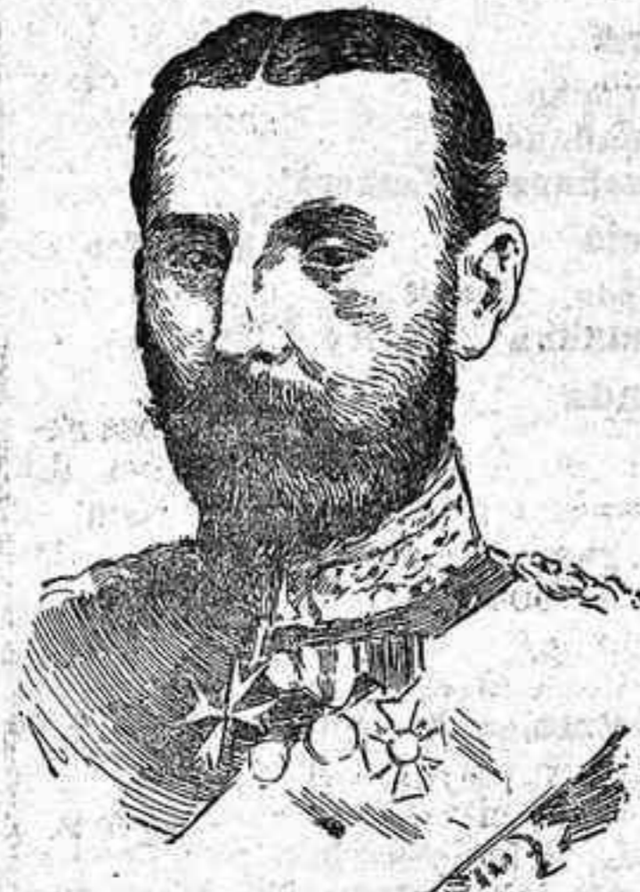
El Príncipe Enrique de Battenberg, padre de la Reina Victoria Eugenia

Un año y medio no basta para conocer á fondo el magnífico, el riquísimo idioma de Cervantes. Pero cediendo á la invitación amable de mi querido ami-