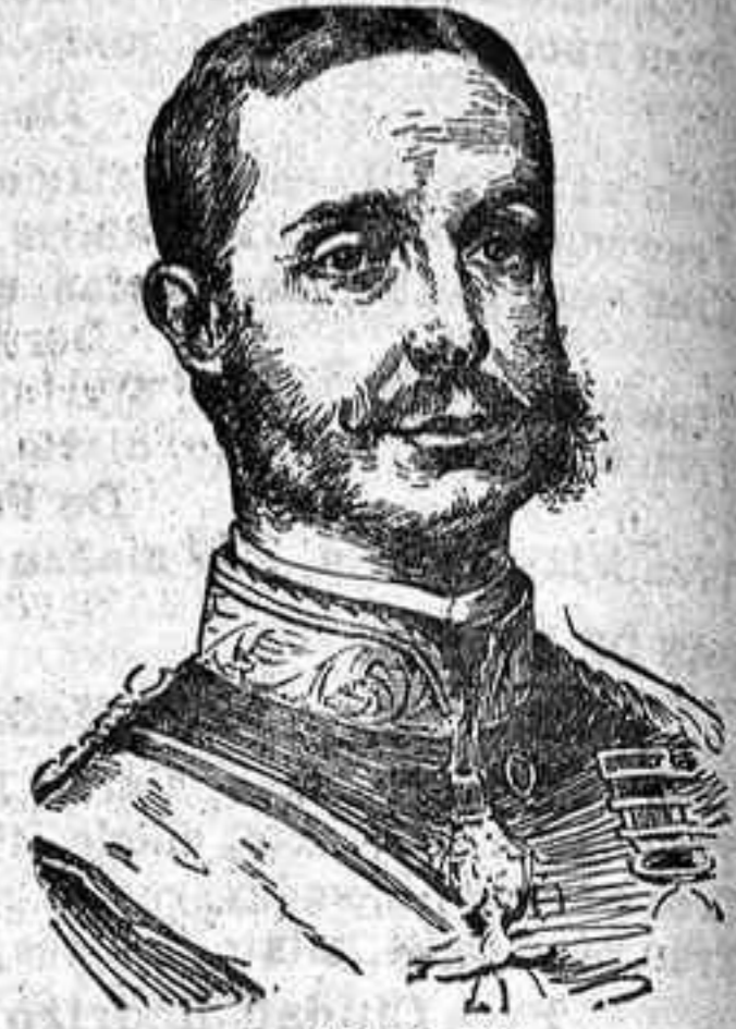
S. M. D. Alfonso XIII

Así también nuestra Reina era fiel á su Iglesia ritualista devota, caritativa, asidua á sus oficios. Iba según su conciencia, y cuando llegó la hora, Dios la concedió la gracia venciendo la inquieta duda. De esta gente se hacen los neófitos más sinceros; así era San Pablo, devoto á judaísmo. Que verdad