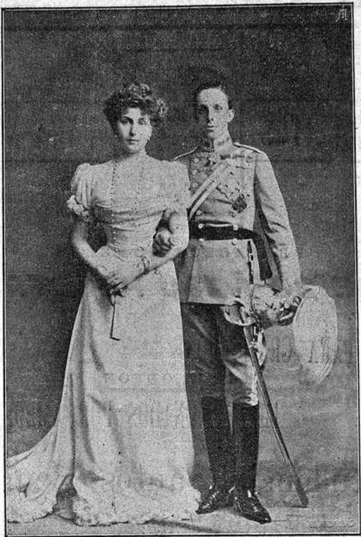
SS. MM. D. Alfonso XIII y D.ª Victoria Eugenia