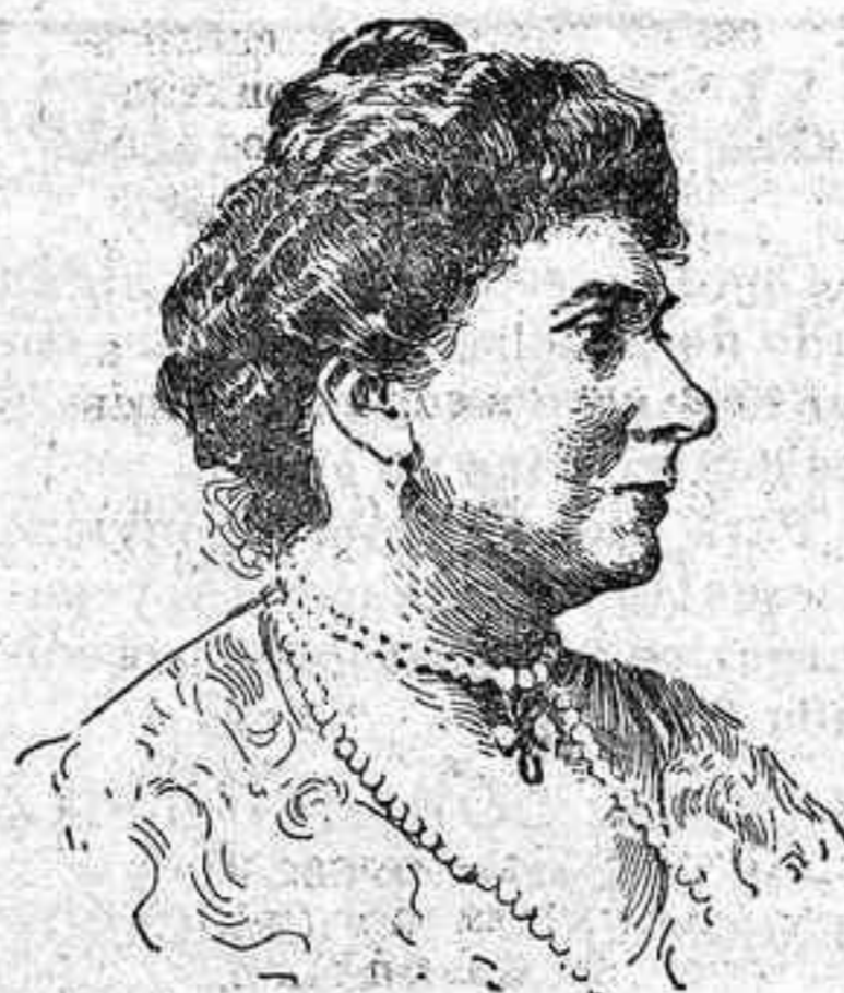
La Princesa Beatriz, madre de la Reina Victoria Eugenia