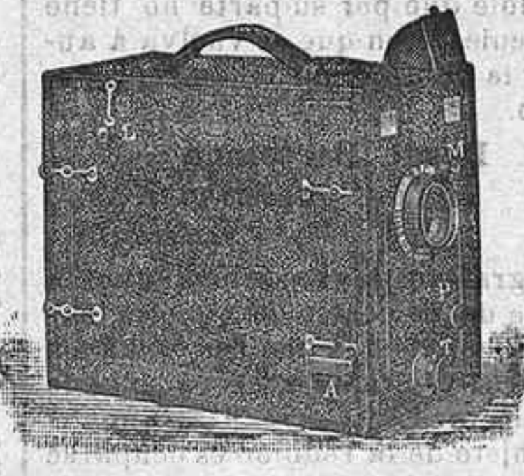
Le Ganga Le Lindo cosmos