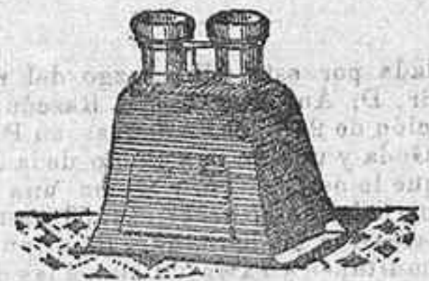
Stereoscopio y doce vistas exposición de 1900, 12 50 PTS.

PLACAS Y PAPELES DE LUMIERE, GUILLENOT, ST. CLAIR, LIENEGANG, AMERICANAS Y ALEMANAS