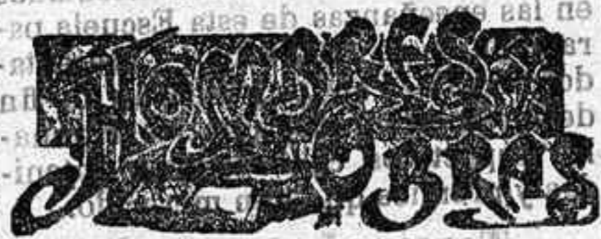
ALFONSO XI DE CASTILLA

Sean las primeras las que van al frente del movimiento social por su saber, su riqueza y su posición. Tienen el deber más grande y la mayor responsabilidad, y los esfuerzos que realicen en ese sentido, no serán perdidos para el progreso nacional.