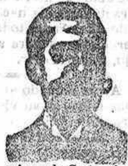
An glo Costanzi Dip. 435, Barcelona