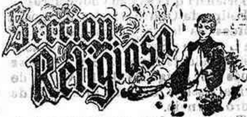
Mañana: San Luis, rey de Francia, San...

Mas como varían las circunstancias y condiciones de cada localidad, se ha dejado a la discreción del Rector de cada distrito el determinar la fecha de apertura en estas Escuelas.