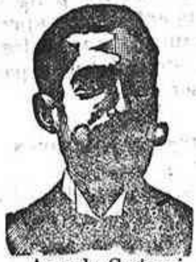
Angelo Costanzi Dip., 345, Barcelona

Preparación la más racional para curar la tuberculosis, catarrros crónicos bronquitis infecciones gripales, enfermedades consuntivas, inapetencia, debilidad general, postración, nerviosa neurastenia, impotencia, enfermedades mental s, caries, raquitismo, escrofulismo etc. Frasco 2'50 pesetas. DEPÓSITO: Farmacia del Dr. Benedicto, San Bernardo 41, Madrid y en la provincia Salamanca, de farmacia del Licdo. Redilla. Guijuelo.