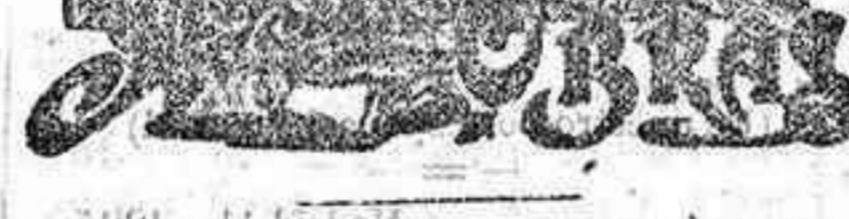
Margarita de Angulema

Los catalanistas le dispensen un entierro solemne. PALMA.