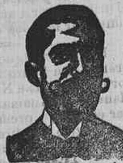
Angelo Costanzi Dip. 435, Barcelona

Especialidad en bombones de chocolate con crema, finísimos caramelos suizos tondat y dulces varios. De venta en todas las confiterías. - Depósito central MONTERA, 25. - MADRID.