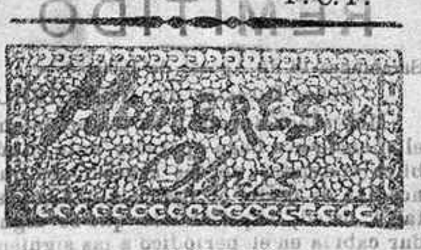
F. C. F.

Hoy se ha celebrado con gran pompa la fiesta á San Roque, siendo mayordomos el simpático camarero del Casino de Salamanca Idefonso Grande y su esposa.