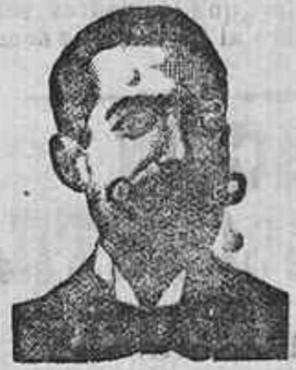
A. SALVATI COSTANZI Diputación, 435, Barcel.

Preparación la más racional para curar la tuberculosis, catarros crónicos, bronquitis, infecciones gripales, enfermedades consuntivas, inapetencia, debilidad general, postración nerviosa, neurastenia, impotencia, enfermedades mentales (aríes, rquitismo, esclerosis, etc. FRASCO, 2'50 pesetas; DEPÓSITO-Farmacia del Dr. Benedicto, San Bernardo, 41, Madrid y en la provincia de Salamanca, farmacia del Ldo. Rodile, Guijuelo.