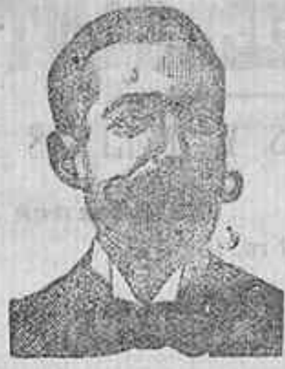
A. SALVATI COSTANZI Diputación, 435, Barcel.

Preparación la más racional para curar la tuberculosis, catarros crónicos, bronquitis, infecciones gripales, enfermedades crónicas, inapetencia, debilidad general, costra nerviosa, anemia, impotencia, e enfermedades menérgicas, y quitismo escurfulismo. C. FRANCISCO, 27. Depósito: DEPÓSITO Farmacia del Dr. Benedicto, San Bernardo, 11, Madrid y en la provincia de Salamanca, Farmacia del Ldo. Rodilo, Guzmán.