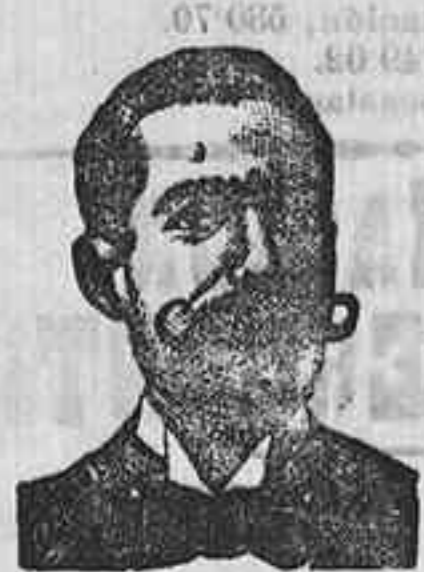
A. SALYATI COSTANZI Diputación, 435, Barcel.

Preparación la más racional para curar la tuberculosis, catarrós crónicos, bronquitis, infecciones gripales, enfermedades consuntivas, inapetencia, debilidad general, postración nerviosa, anemia, impotencia, enfermedades menéales, caries, reumatismo, escrofulismo, etc. FRASCO, 2'75. Depósito: DEPÓSITO Farmacia del Dr. Benedicto, San Bernardo, 41, Madrid y en la provincia de Salamanca, farmacia del Lado Rodilo, Guzmán.