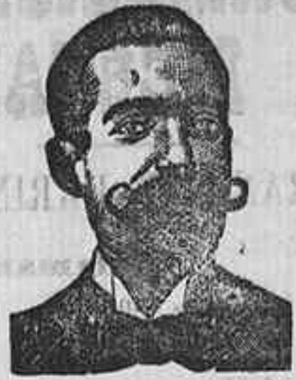
A. SALVATI COSTANZI Diputación, 435, Barceñ.

Preparación la más racional para curar la tuberculosis, catarros crónicos, bronquitis, infecciones gripales, enfermedades consuntivas, inapetencia, debilidad general, prostración nerviosa, neurastenia, impotencia, enfermedades mentales, caries, y quitismo escrofuloso, etc. FRASCO, 2'50 pesetas. DEPÓSITO Farmacia del Dr. Benedicto, San Bernardo, 41, Madrid, y en la provincia de Salamanca, farmacia del Lado, Rodillo, Gualqueo.