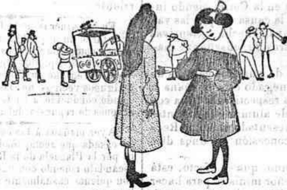
(Dibujo de J. Hemard)

—Estoy desesperada, amiga mía. Mirale allá abajo; ahora le ha dado por la bebida.