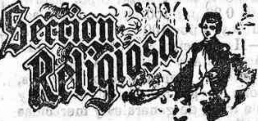
Mañana: Santa Catalina, virgen y Santos Gonsa'o obispo y Moisés.

Santa Catalina, virgen.—Nació en Alejandría. Empezó los primeros años de su vida en el estudio de las letras sagradas y profanas; y como estaba dotada de excelente ingenio, llegó á ser un prodigio de sabiduría.