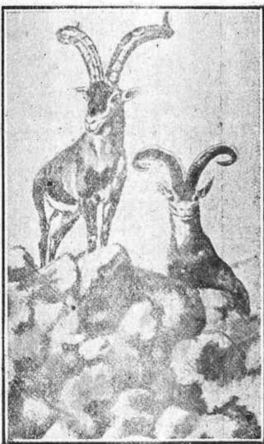
Capra Pirináica (llamada Montés). De «Riquezas Patrias»

Al empezar la temporada de excursiones alpinas, creemos cumplir con un deber patriótico y a más de patriótico humanitario—para que no se dejen sorprender con tendenciosas informaciones hijas solo del antagonismo, informando viciadamente a los excursionistas,—dando a conocer al público en general los sitios reconocidos como más cómodos, cortos y viables para realizar la ascensión a los puntos más altos y pintorescos de nuestra imponderable Sierra de Gredos .