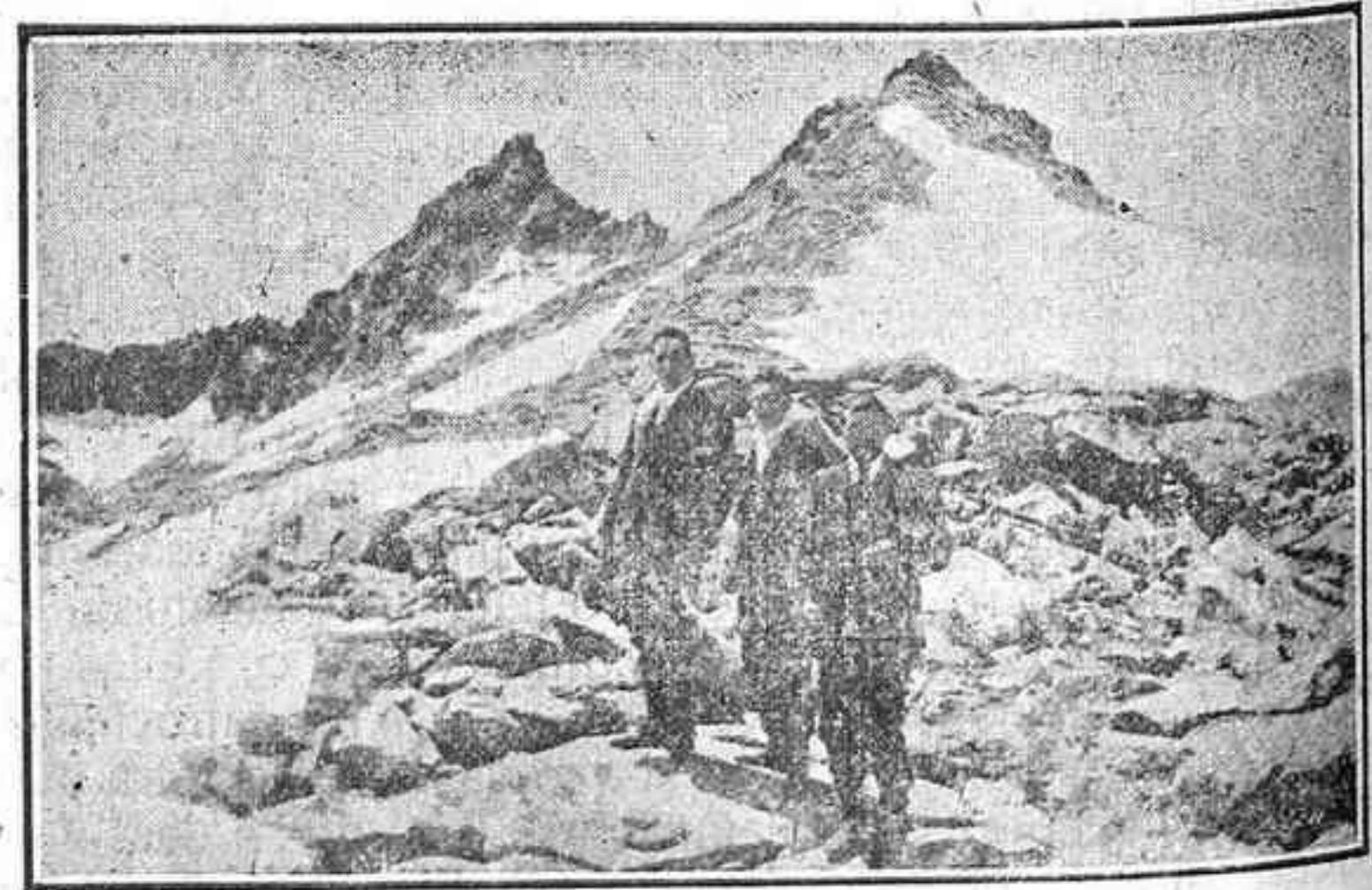
Meseta Central de Gredos (Verde de O).—De «Riquezas Patrias»

NOTA. Se envían folletos gratuitos a quien lo solicite, del Sindicato de Turismo de Barco de Avila y del Excursionista de Gredos con domicilio en Bohoyo, de donde también el alpinista puede recoger datos interesantes.