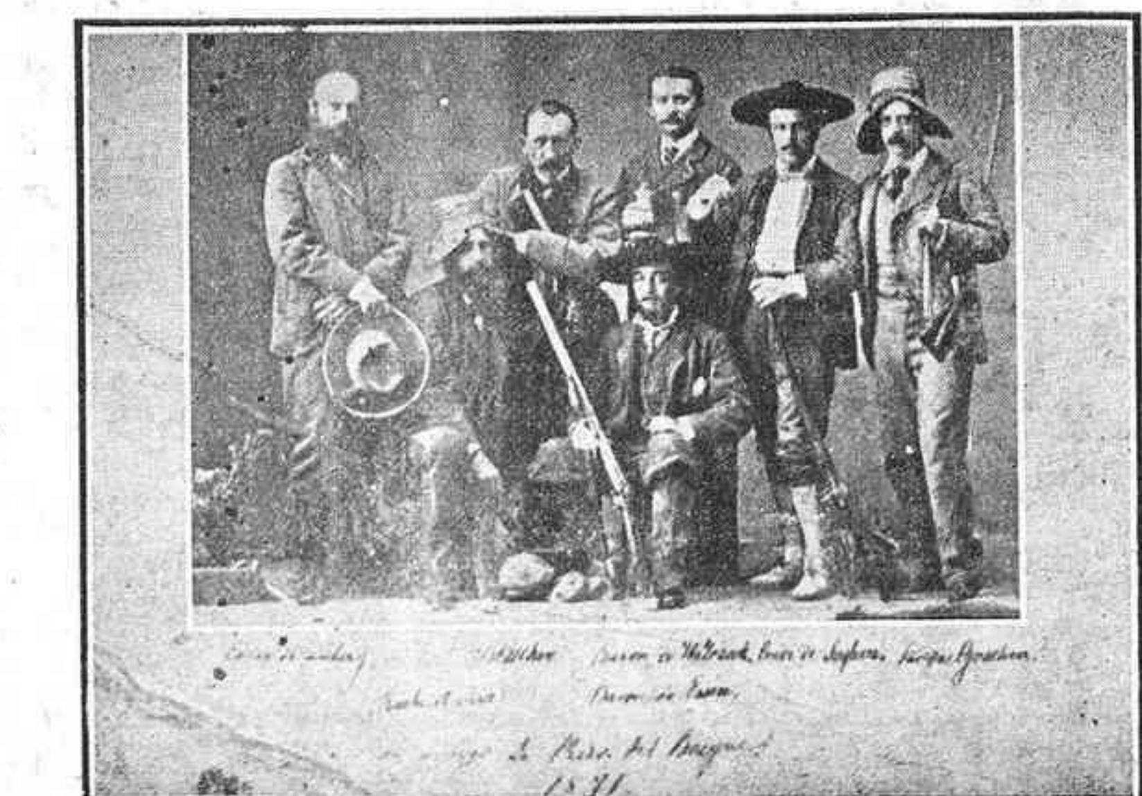
Cacería Regia (Príncipes de Gales).—De «Riquezas Patrias»

Si a esto se agrega que «RIQUEZAS PATRIAS» va también ilustrada con cuatro planas litográficas a tres tintas, una elegante portada también litográfica y más de noventa fotograbados de los sitios más importantes del valle y de la montaña, sacaremos la consecuencia irrefutable que en realidad, la obra de que nos ocupamos, es la más amplia, la más instructiva y la que se hace necesaria a todo buen alpinista, como así lo atestiguan buen número de opiniones publicadas, unas en la prensa e inéditas las más, de grandes prestigios del arte y de la ciencia.