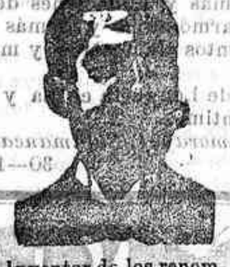
Inventor de los renombrados medicamentos COSTANZI , Dip. 485, Barcelona.