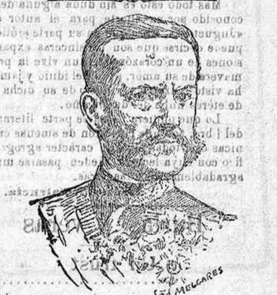
D. Valeriano Weyler ministro de la Guerra

... de la Federación Obrera Si el espacio de que podemos disponer