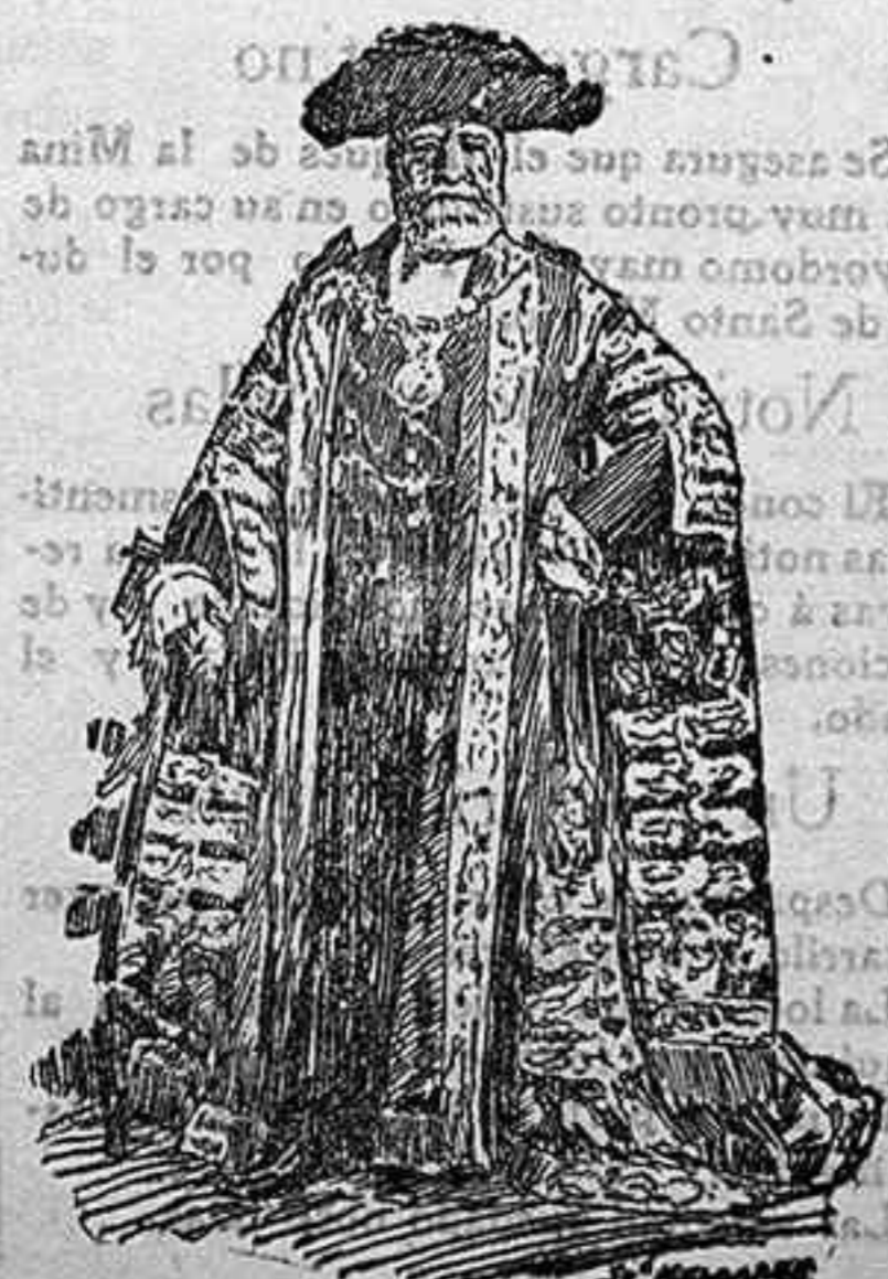
El viaje á Paris del alcalde de Londres, sir

Walter Vangha Morgan, es una de las actuali- dades de más relieve en la vieja república.