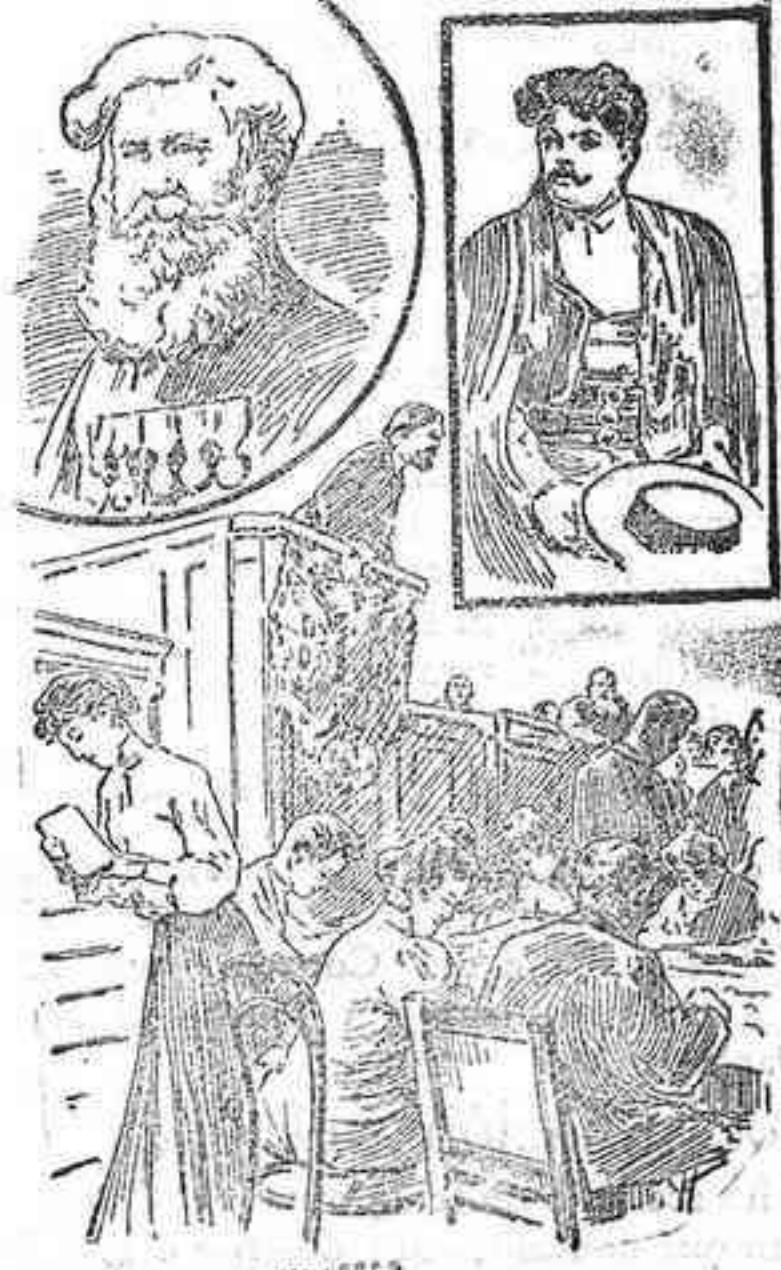
Para representar á una nación de 400 millones de habitantes, la Duma sólo consta de 414 diputados, en suso los polacos. Pueden clasificarse este número de representantes del modo siguiente, respecto á su filiación política más general: De la izquierda, ó liberales, 258; del centro, 62; polacos, 29; cosacos del Ural, de los cuales no se sabía al constituirse la Duma, ni sus quinientos eran, 8; de la derecha, 13; indefinidos, 19.

La Duma, producto de la ley electoral de 19 de Agosto de 1905, reformada en 30 de Octubre del mismo, y luego en Marzo de 1906, se ha reunido el 10 de Mayo en el palacio Tauride de San Petersburgo, y se compone de los diputados elegidos por las provincias rusas exceptuadas las del Mar Negro y las del Amur