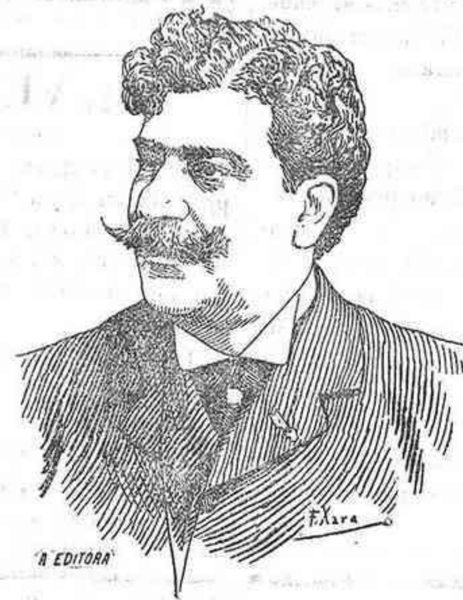
Rafael Bordallo Pinheiro