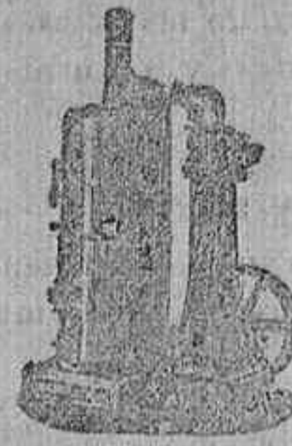
AQUINA DE VAPOR VERTICAL