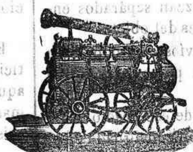
Máquina de vapor locomovil.