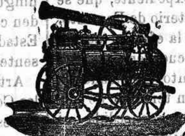
Máquina de vapor locomovil