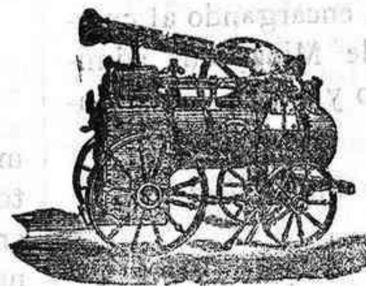
Máquina de vapor locomovil.