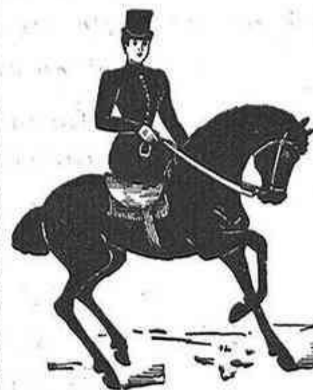
No confundirse: junto al Cuartel del Conde. 52-7