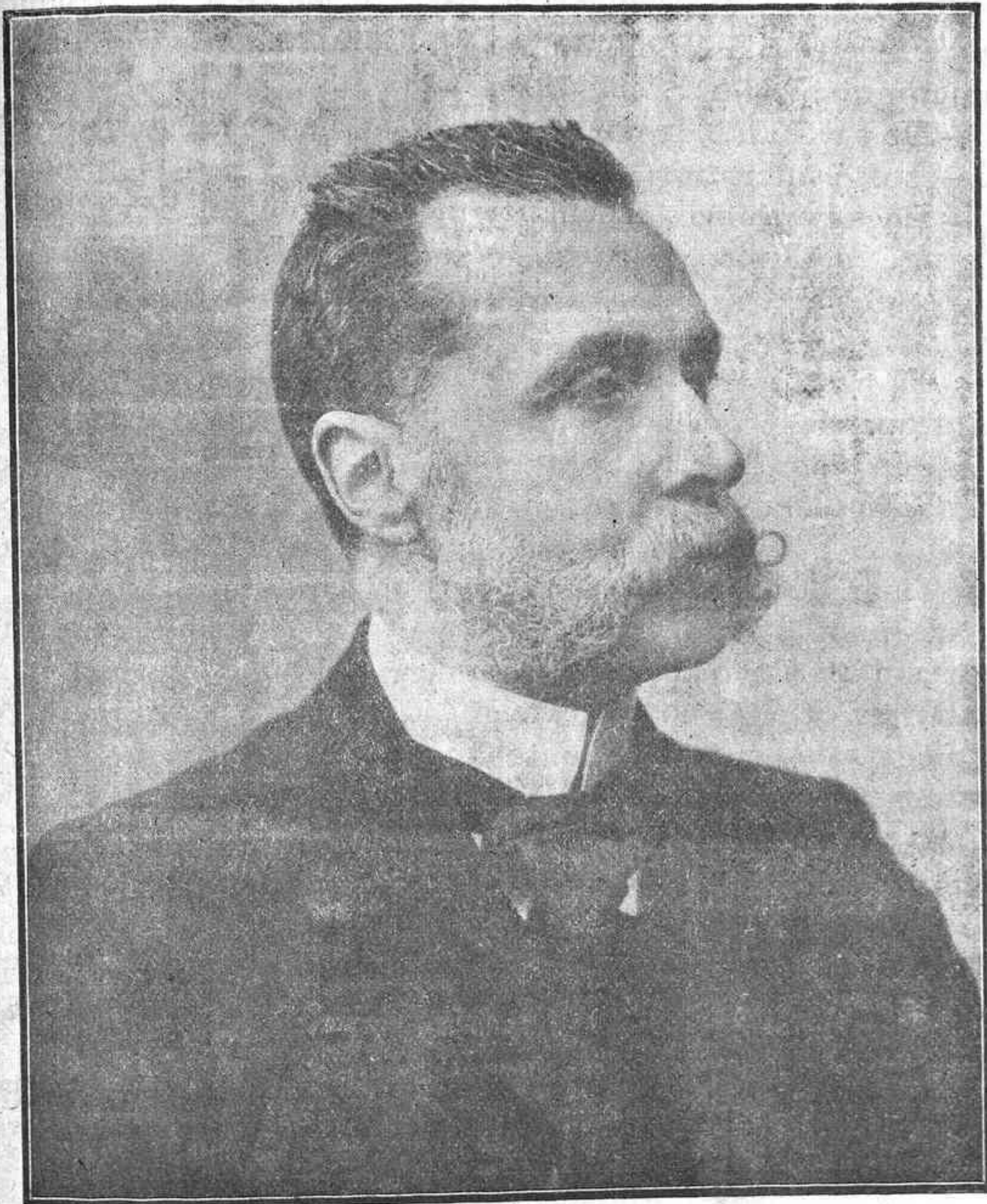
EXCMO. SR. EX-DIRECTOR DEL INSTITUTO GENERAL Y TÉCNICO DE SALAMANCA